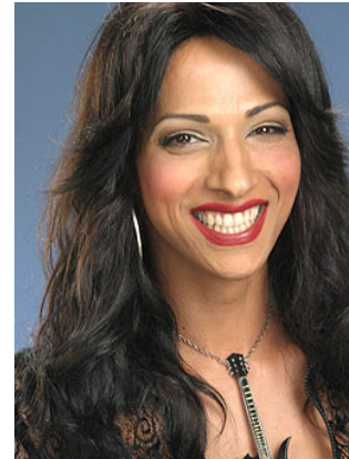
דנה אינטרנשיונאל זמרת טרנסג'נדרית מצליחה