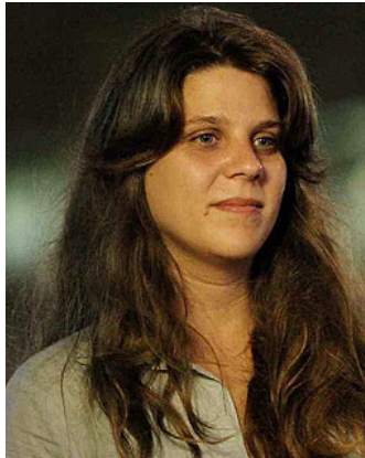
דפני ליף מי שהובילה את המהפכה החברתית