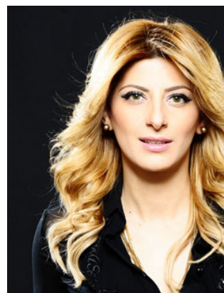
שרית חדד זמרת מזרחית מצליחה