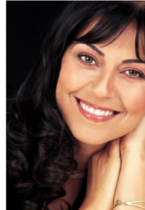
אמל מורקוס זמרת ושחקנית ערביה ישראלית