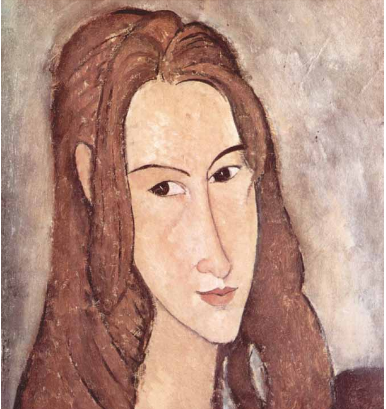
אמדאו מודיליאני, דיוקן ז'אן אבוטראן, 1918

זיאן היתה תלמידת אמנות צעירה שהתאהבה בצייר ובחרה לחיות איתו למרות התנגדות משפחתה. מודיליאני הדגיש את עדינותה ורכותה בעזרת הדגשת הקו הרצוף בפנים, באף, בגבות ובשיער והאריך מאוד את הפנים והצוואר. בכך העניק לדמות יופי חלומי ועדין.