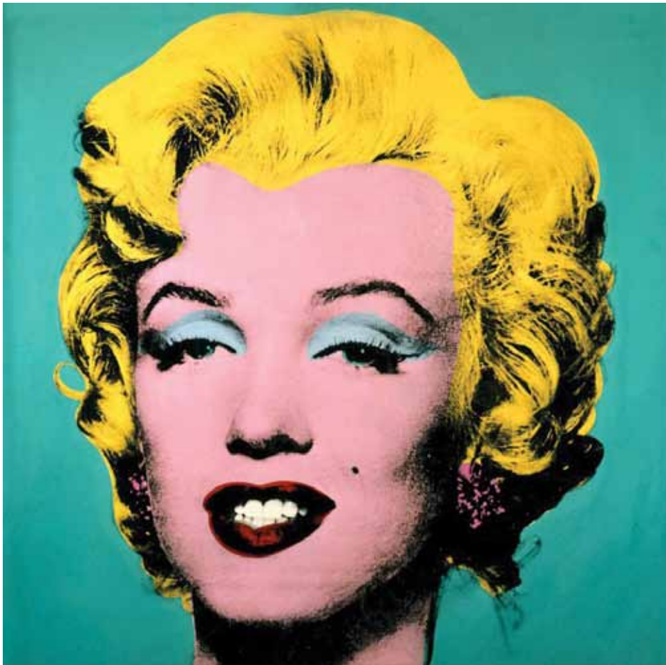
אנדי וורהול, מרילין מונרו, 1962

מרילין מונרו נחשבת לסמל האשה החושנית של שנות ה-60 באמריקה. יופייה מוחצן ומודגש, בשערה הבלונדיני, שפתיה האדומות. איפור מודגש, חיוך מתגרה ועיניים חצי עצומות. וורהול תפס את כל המאפיינים האלה והדגיש אותם עוד יותר עד כדי שטיחות המעוררים כלפיה גם הערצה וגם ביקורת.